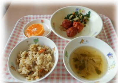
肉団子の甘辛煮、ほうれん草お浸し すまし汁 果物