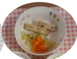
チキンミートローフ