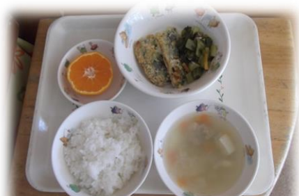
魚のパン粉焼き、小松菜の煮びたし、さつまい