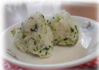
青菜としらすのおにぎり