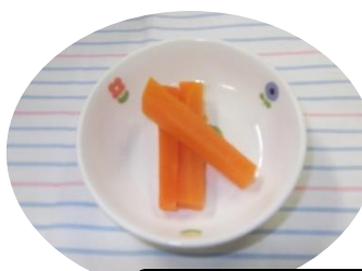
にんじんスティック