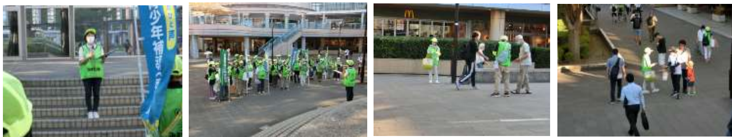
※県下一斉合同パトロールの様子

子どもたちが安全に過ごすことができるように補導員による「愛のひと声」をかけながらのパトロールや啓発活動を行いました。