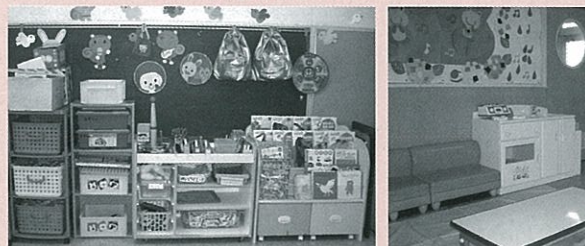
預かり保育が行われている教室風景

月~金 午前7時30分~9時 午後2時~6時30分 夏休みなど 月~金 午前7時30分~午後6時30分 ※なお、県民の日など実施しない日があります。