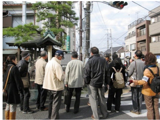
写真：景観資源を探すまちあるきの様子