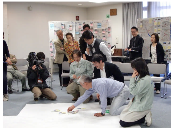
写真：景観資源リストの中間発表