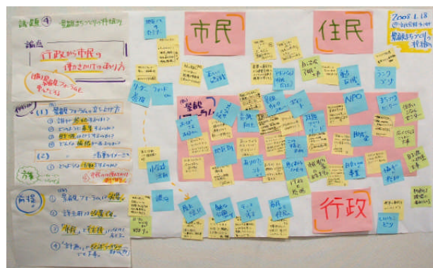
景観計画等策定協議会での意見

協議会の中では、景観重点区域を指定したほうがよいのではないか、無電柱化を進めるべきでは、景観に対する市民の役割とは、など様々な議論がありました。