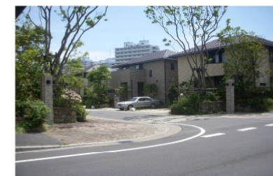
街区の入り口の演出(戸建て住宅)