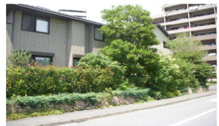
低木・中木主体のグリーンネットワーク(戸建て住宅)