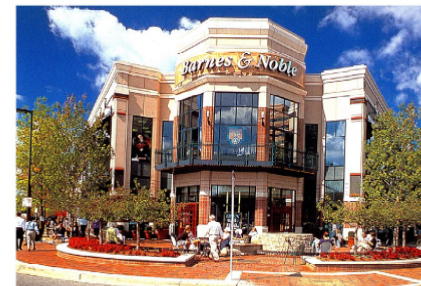
建築物の意匠に配慮した街角(沿道街区)