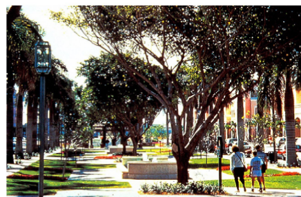
グリーンネットワーク(計画住宅)