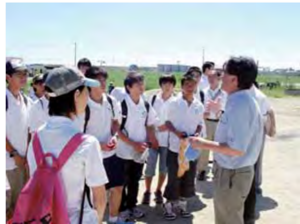
ふるさとうらやす立志塾 in 石巻

対象を市立中学校の生徒会役員等のリーダーとし、宿泊研修を通して、企業や行政のリーダー、文化・スポーツに優れた方の講話を聴いたり、意見交換をしたりする場を設け、将来の浦安市のリーダーとして活躍する人材の育成を目指します。