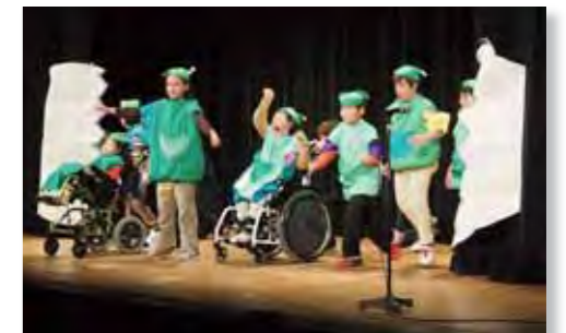
特別支援学級の子どもたちによるはっぴいはっぴようかい

就学前から義務教育9年間を見通した指導方法や校内の運営体制など、小中連携・一貫教育のあり方について調査研究を進め、浦安市に適した小中連携・一貫教育を推進します。