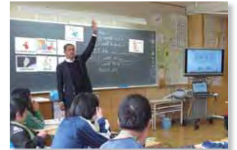
ALTを活用した外国語活動

小・中学校にALT(外国語指導助手)を配置し、英語への関心意欲を高めるとともに、国際理解教育の推進を図ります。