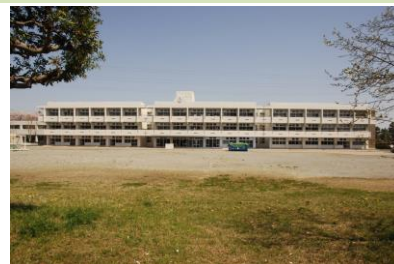
まちづくり活動プラザ

入船地区学校統合に伴い平成27（2015）年3月に閉校した「旧入船北小学校」を用途変更し、「まちづくり活動プラザ」として改修しました。旧校舎を活用した、まちづくり活動団体及び市による事業の実施に加え、多目的室、体育館、運動場の貸し出しを行います。