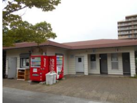
高洲中央公園管理事務所 及びトイレ