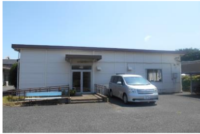
ソーシャルサポートセンター

新浦安駅前地域活動支援センターは、旧新浦安駅前行政サービスセンターから地域活動支援センターに用途変更した施設です。