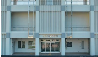
運動公園野球場（スタンド棟）

運動公園野球場は、センター122メートル、両翼98メートルの、硬式野球と軟式野球が行える人工芝の野球場です。付帯施設として、スタンド棟、スコアボード棟を備えています。