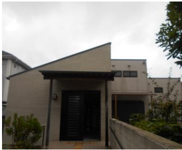
堀江元町クラブ会館

高齢者福祉施設のひとつに、老人クラブ会館があります。老人クラブでは、会員が互いに親睦を深め、健康を増進し、教養を高め合うとともに、奉仕活動などを通じ地域社会との交流を図っています。一部の地区を除き、市域全域に35施設（自治会集会所との合築タイプである5施設を含む）整備されています。