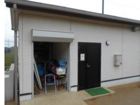
総合公園球技場本部棟