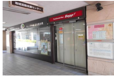
新浦安駅前地域活動支援センター