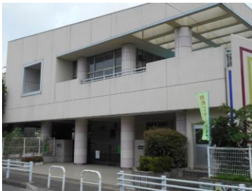
みなみ認定こども園