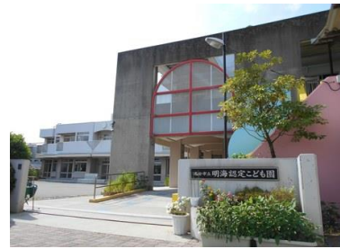
明海認定こども園