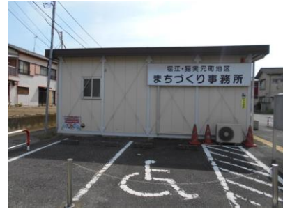
まちづくり事務所

まちづくり事務所では、堀江・猫実元町中央地区（やなぎ通り、宮前通り、受け入れ線、大三角線に囲まれた地区）の中央部のさまざまな課題を解消するため、再整備に向け、地元の方々への説明会や勉強会、相談などを行っています。