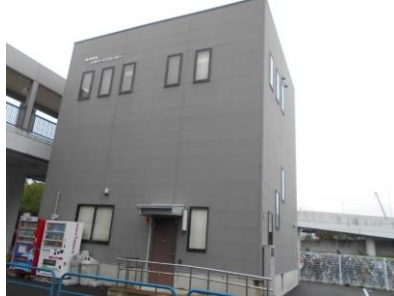
舞浜駅前行政サービスセンター

行政サービスセンターは、市内の各駅前にあります。市役所とオンラインで結び、各種証明書の交付を行っています。