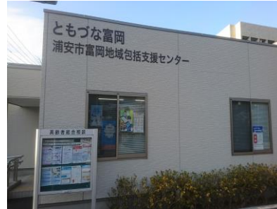
富岡地域包括支援センター （本棟）