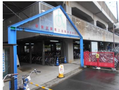
新浦安駅第2自転車駐車場（増築後）