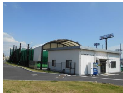
運動公園アーチェリー場

運動公園アーチェリー場は、オリンピック・パラリンピックの競技で採用されている 70 メートルの距離を射ることができるもので、横幅も 15 メートルと国内屈指の規模を誇ります。