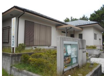
富岡自治会集会所