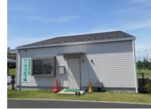
高洲海浜公園 パークゴルフ場