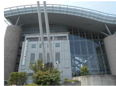
運動公園総合体育館

本市には、運動公園総合体育館があります。「スポーツ・リフレッシュ&コミュニケーション」を基本テーマに、生涯スポーツの普及・振興のため、さまざまなスポーツ活動のお手伝いをする施設です。メインアリーナ、サブアリーナ、トレーニング室、第1武道場・第2武道場、弓道場、卓球室、卓球コーナー、多目的室・会議室などがあります。