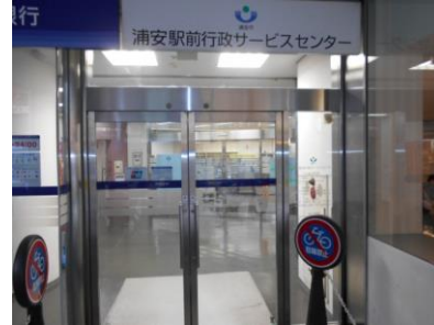
浦安駅前行政サービスセンター