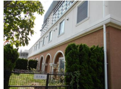
青少年交流活動センター うら・らめ〜る

本市には、「青少年交流活動センター うら・らめ〜る」という宿泊・研修施設があります。主に青少年の交流や団体生活を通じて青少年の健全な育成を図るための宿泊型研修施設で、学校や青少年団体のほか、一般の方（2人以上のグループ）も使用できます。また、一部の部屋は、宿泊をしない方も使用できます。