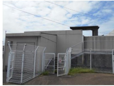
船塚川第2排水機場