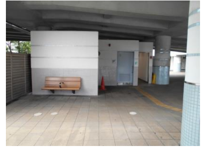
舞浜駅公衆トイレ