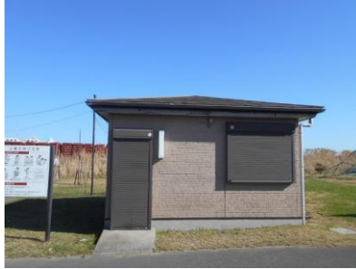
高洲海浜公園管理事務所