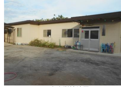
日の出小学校地区 児童育成クラブ