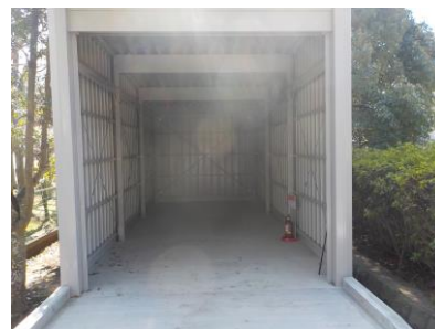
災害ボランティアセンター倉庫

常設型の災害ボランティアセンターを設置し、平常時より、ボランティア活動のための対策を推進しています。倉庫は、災害時に必要な物資を収納するために、設置しています。