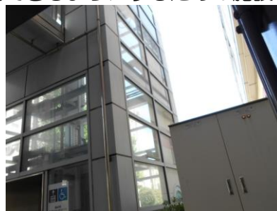
新浦安駅舎北側エレベーター棟