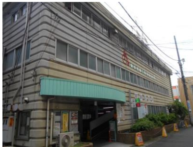
浦安駅第1自転車駐車場

本市には、浦安駅、新浦安駅、舞浜駅の周辺に自転車駐車場があり、大きく分けて平置き、構築物、建物の3つのタイプがあります。本白書では、建物のタイプの自転車駐車場及び管理棟を対象に建物の性能評価を行いました。