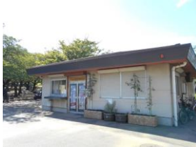
中央公園管理事務所