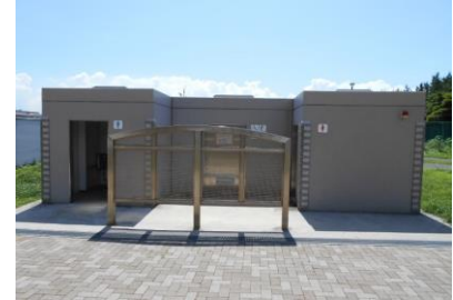
高洲地区西側緑地(中央区域) トイレ