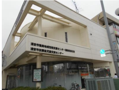
猫実地域包括支援センター 浦安駅前支所

高齢者の介護・介護予防などに関する相談、調整、連携の総合窓口として、4カ所の地域包括支援センター（ともづな）と2カ所の地域包括支援センターの支所を設置しています。