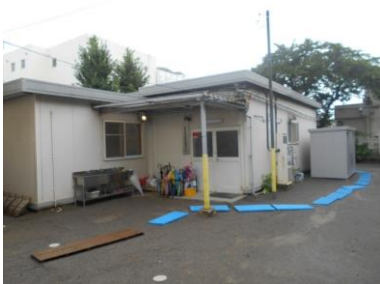
北部小学校地区児童育成クラブ

児童育成クラブでは、昼間に保護者が就労などで留守になる家庭の小学校1年生～4年生の児童と療育手帳などを持っている6年生までの児童を対象に、放課後や夏休みなどに支援を行っています。