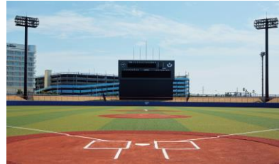
運動公園野球場（スコアボード棟）