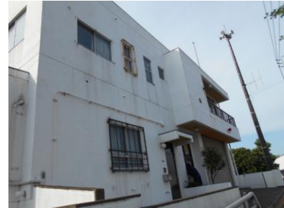
消防団第1分団詰所

本市には、非常備消防として、3つの消防団（第1分団、第2分団、第3分団）があり、それぞれに詰所があります。