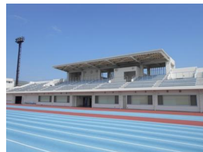
運動公園陸上競技場（スタンド棟）

競技場内には、1,000 席の観客席があるスタンド棟と、正確な計測を行うための写真判定棟があります。