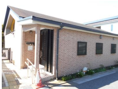
舞浜レインボーくらぶ会館