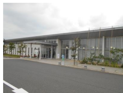
墓地公園管理棟および集会施設

墓地公園は、「ふるさととして心のよりどころとなる墓地」を基本理念に、日の出地区東側の海岸寄りに平成4（1996）年に開園した、海を望む約4万坪の霊園です。墓地管理事務所は、墓地周辺の区管理を行うために設置しています。