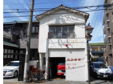
消防団第3分団第3器具置場