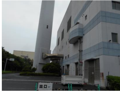
クリーンセンター（工場棟）

クリーンセンターでは、本市のごみ処理とリサイクル、し尿処理を行っています。施設内のピーナスプラザでは、市民の方々が主役となってリサイクル活動を行う場となっています。