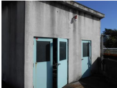
山城屋前排水機場

排水機場は、降水時に浸水しないように、雨水を川へ排水するための施設です。本市には、排水機場等が22か所あり、そのうち12か所が建物のタイプ、10所がポンプ設備のみのタイプです。本白書では、建物のタイプの排水機場を対象に建物の性能評価を行いました。