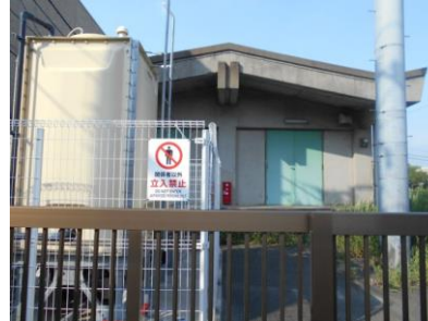
東野防災備蓄倉庫