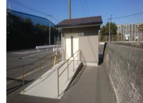
高洲南テニスコート 多機能トイレ