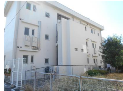
猫実複合福祉施設（旧教職員住宅）