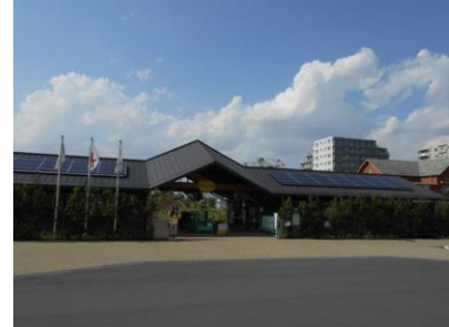
こどもの広場管理棟