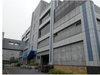
クリーンセンター（リサイクルプラザ）