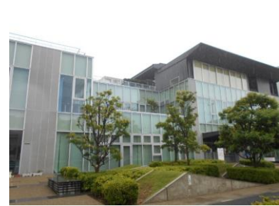
エスレ高洲（高洲公民館）