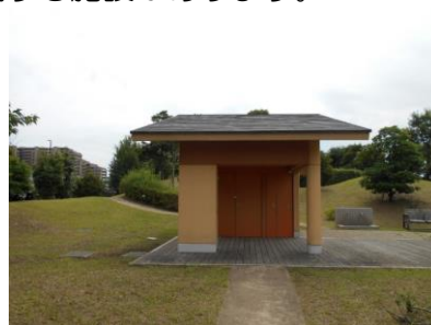
明海の丘公園コミュニティハウス