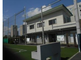
明海球技場管理棟