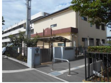
入船小学校地区児童育成クラブ