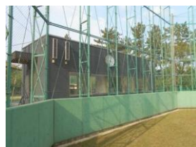
中央公園野球場本部棟