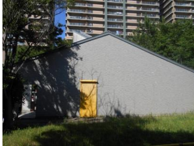
高洲中央公園防災備蓄倉庫

本市では、これまでに大規模な公園内、各地区の公民館、災害時の避難所に指定している市内の小・中学校及び高等学校・大学などへ防災備蓄倉庫を設置し、食料・毛布などや防災用資器材等の備蓄の整備を図っています。本白書では、個別の建物で整備した防災備蓄倉庫を対象とします。