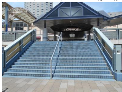
新浦安駅自由通路

新浦安駅及び舞浜駅には、自由通路やエレベーターが整備されています。これらは、駅の南北のエリアをバリアフリーで円滑に移動できるようにするための施設です。