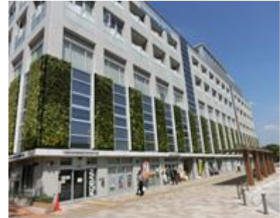
新浦安駅前複合施設 マーレ

新浦安駅前複合施設 マーレは、新浦安駅前にある複合用途施設で、保育所、自転車駐車場、国際センターなどの機能が入っています。この施設は、建設から施設管理までをPFI事業により行っています。