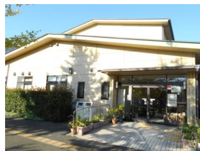
若潮公園体験学習施設

若潮公園体験学習施設は、天候に左右されずに遊ぶことができる屋内施設で、運動や動物とのふれあいのほか、子供たちが楽しみながら交通知識や交通道徳を身につけることができます。