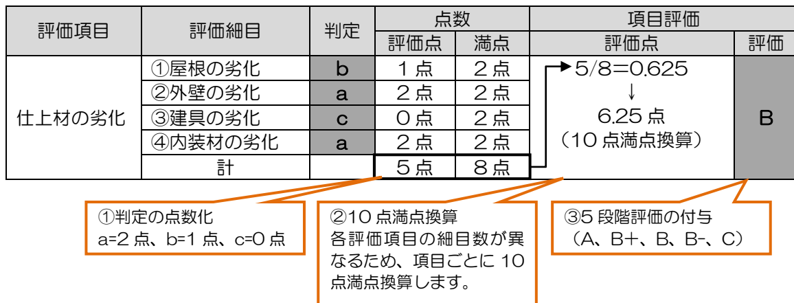
図 4.1 評価の手順

まず、各評価細目の判定結果を、aは2点、bは1点、cは0点と点数化しました。次に、評価項目ごとに評価細目の数が異なることから、評価項目ごとに重みを同じにするため、10点満点換算を行いました。さらに、評価結果をわかりやすくするために、算出された点数に応じて5段階で評価を表現しました。