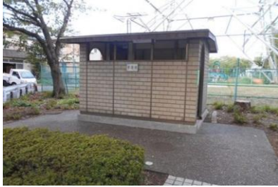
しおかぜ緑道トイレ (富士見1丁目)