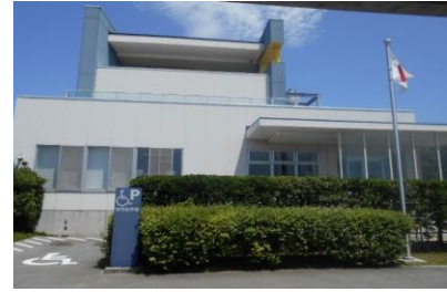
浦安市ワークステーション

浦安市ワークステーションは、働く意欲のある障がいのある方の就労相談や、一般就労へのコーディネート機能を担う障がい者就労支援センターと、障害者総合支援法に基づく福祉的就労施設、障がいのある方を直接雇用する一般就労施設である特例子会社 2 社を併設した複合施設です。