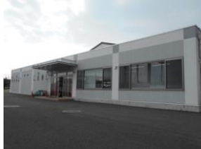
運動公園球技場管理棟