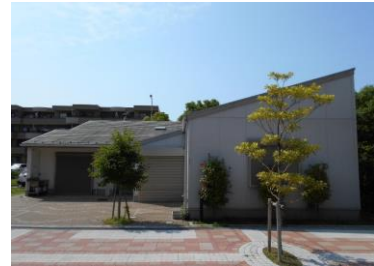
セレナヴィータ新浦安自治会集会所