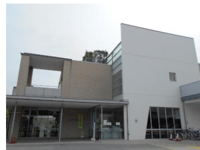
老人福祉センター

老人福祉センターは、「Uセンター」という愛称で親しまれており、高齢者の方々が、いつまでも健康で生きがいのある生活を営むことができるよう、「心と身体の健康づくり」を目的として設置された老人福祉施設です。60歳以上の市民が利用でき、入浴施設、娯楽コーナー、各種サークル・講座などを楽しむことができます。