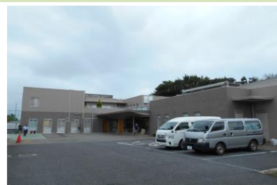
障がい者福祉センター・ 障がい者等一時ケアセンター

障がい者等一時ケアセンターは、障がいのある方に対して、障害者総合支援法に基づく短期入所事業、日中一時支援事業及び市独自事業の緊急時預かり事業を行っています。