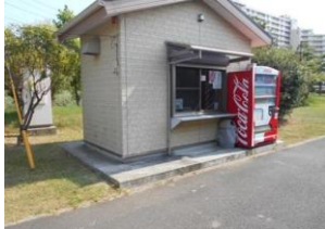
高洲太陽の丘公園 テニスコート管理棟