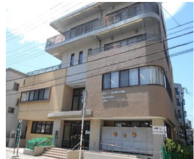
浦安駅前保育園・ 浦安駅前高齢者デイサービスセンター

浦安駅前保育園・浦安駅前高齢者デイサービスセンターは、保育園と高齢者デイサービスセンターの複合施設です。