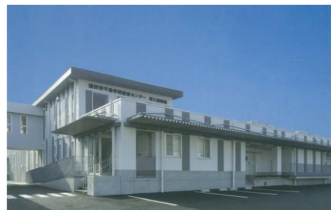
千鳥学校給食センター（第3調理場）