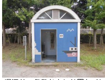
堀江ドックなかよし公園トイレ