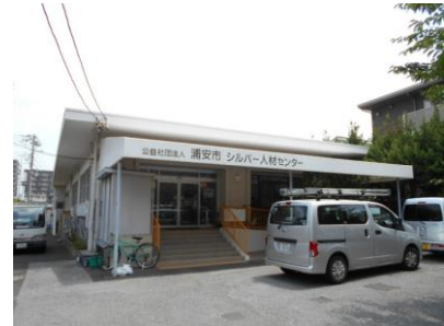
シルバー人材センター

シルバー人材センターでは、公共団体、民間企業、家庭からの仕事を引き受け、会員の希望と経験・能力に応じて、請負または委任という形式で、その仕事に従事しています。