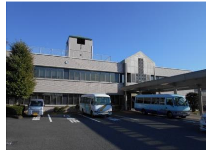
総合福祉センター

総合福祉センターは、身体障がい者福祉センター、こども発達センター、東野児童センター、こども家庭支援センター、地域福祉センター、社会福祉協議会（ボランティアセンター、うらやすファミリーサポートセンター）、保育室ゆるり・一時預かりの各機関を有する総合的な福祉施設です。