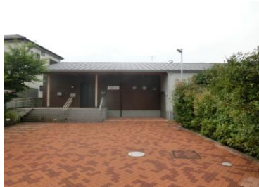
堀江二丁目自治会集会所・ 江川第一クラブ会館

主に地域の自治会活動などの拠点施設として、自治会集会所が64施設あります。一部の地区を除き、市域全域に整備されています。近年では、老人クラブと合築したり、市民活動団体との協働による事業の実施など、形態や用途が幅広くなっています。