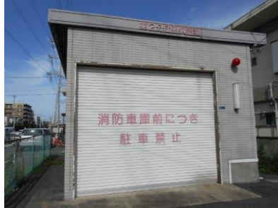
消防団第2分団第3器具置場