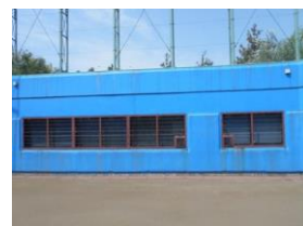
高洲中央公園 少年野球場本部棟