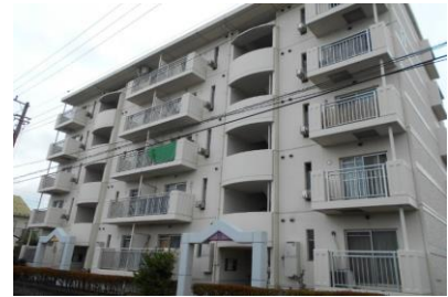
堀江市営住宅（1号棟）

本市には、住宅に困っている低所得者に対し安い家賃で賃貸することにより、市民生活の安定と社会福祉の増進に寄与することを目的に整備した市営住宅が3施設（4棟）あります。