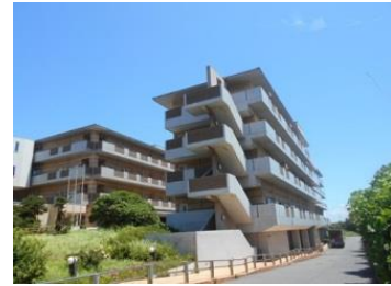
高洲高齢者福祉施設

高洲高齢者福祉施設では、特別養護老人ホーム、ショートステイ、ケアハウス、高齢者デイサービスセンター、高洲地域包括支援センターを設置し、高齢者のニーズに合わせたサービスを提供しています。