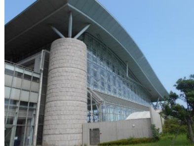
運動公園屋内水泳プール