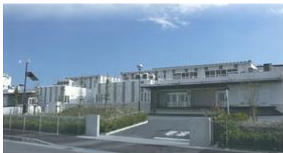
千鳥学校給食センター（第1・第2調理場）

千鳥学校給食センターは、PFI 事業により、建設から給食の調理・施設管理まで民間事業者が運営しています。給食の提供については、小学校 17 校・中学校 9 校に確実な衛生管理のもとで、「安全でおいしい給食」を提供しています。