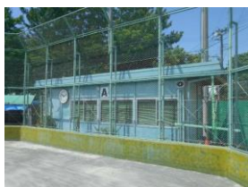
今川球技場本部棟 (A面本部棟)

本市には野球場と少年野球場がそれぞれ3か所と、ソフトボール場が2か所あります。そのうち、4か所の球技場には本部棟があり、放送設備などが整っています。