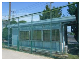
大三角公園少年 野球場本部棟