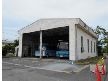
車庫（市役所バス専用車庫）