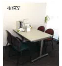
個室で相談が受けられます （※秘密は守られます）