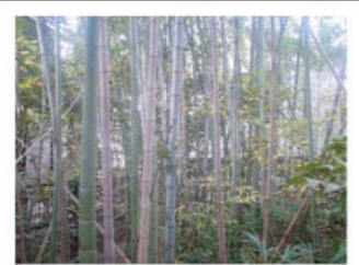
モウソウチク群落