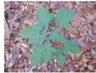
ヒヨドリジョウゴ