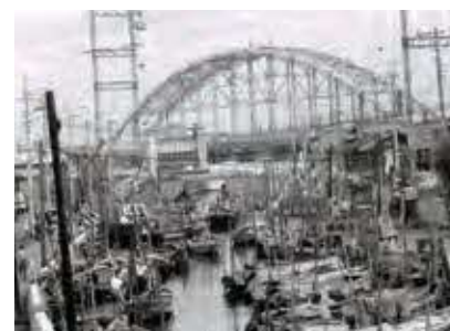
東京メトロ東西線浦安駅開業（1969年）前後の境川。 川沿いにたくさんの漁船が浮かぶ