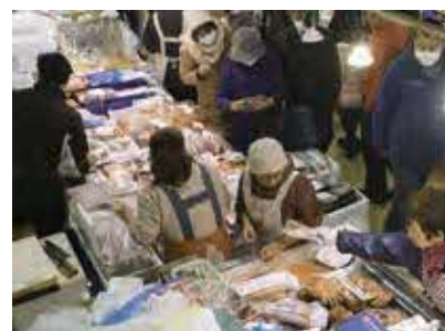
2018年、最後の年末大売り出しを迎える浦安魚市場