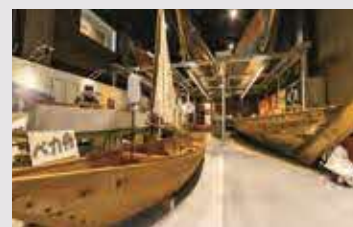
かつて浦安の漁業で活躍した木造船の展示も