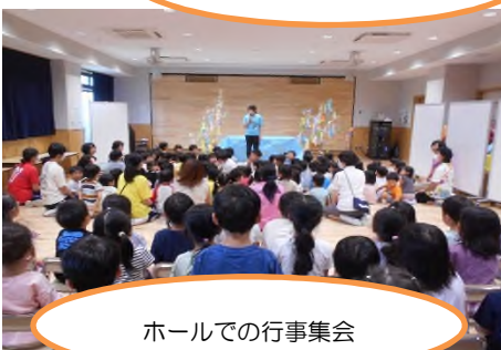
ホールでの行事集会