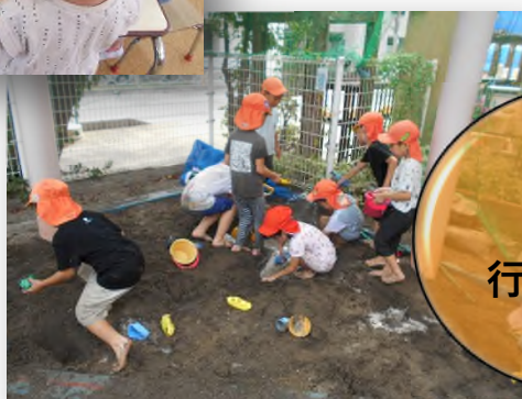
季節の 行事や遊び

保育室では、身近にあるおもちゃを使った遊びだけでなく、描画活動や感触遊びなども行っています。室内遊戯室を使って、運動遊びやリズム遊び、表現遊びなども取り入れ、年齢に合わせた活動を行っています。