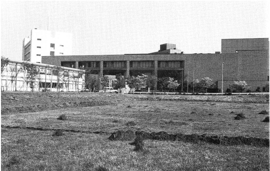
秋山の金魚池跡(1990年)