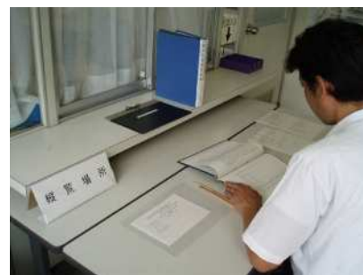
事業計画(案)の縦覧の様子