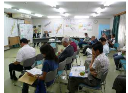
地区住民説明会の様子