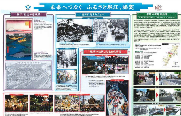
元町の歴史・伝統・風物詩と区画整理事業概要の紹介（公園側）