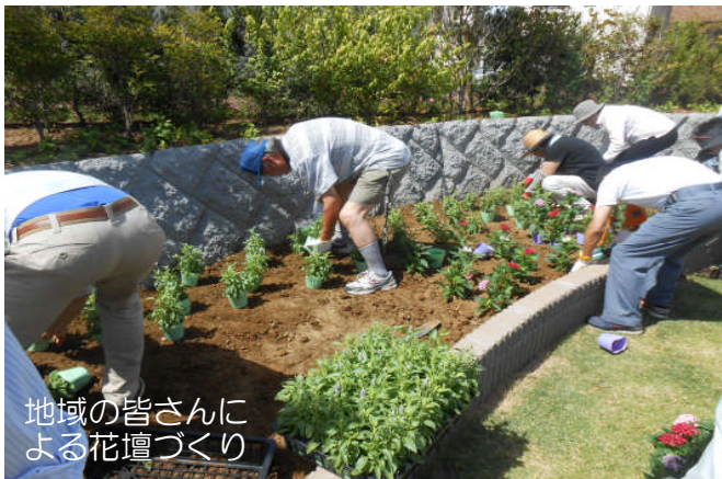
地域の皆様による花壇づくり

また、堀江つどいの広場、もみじ広場にてイルミネーションが12月8日～25日までの期間で点灯されています。