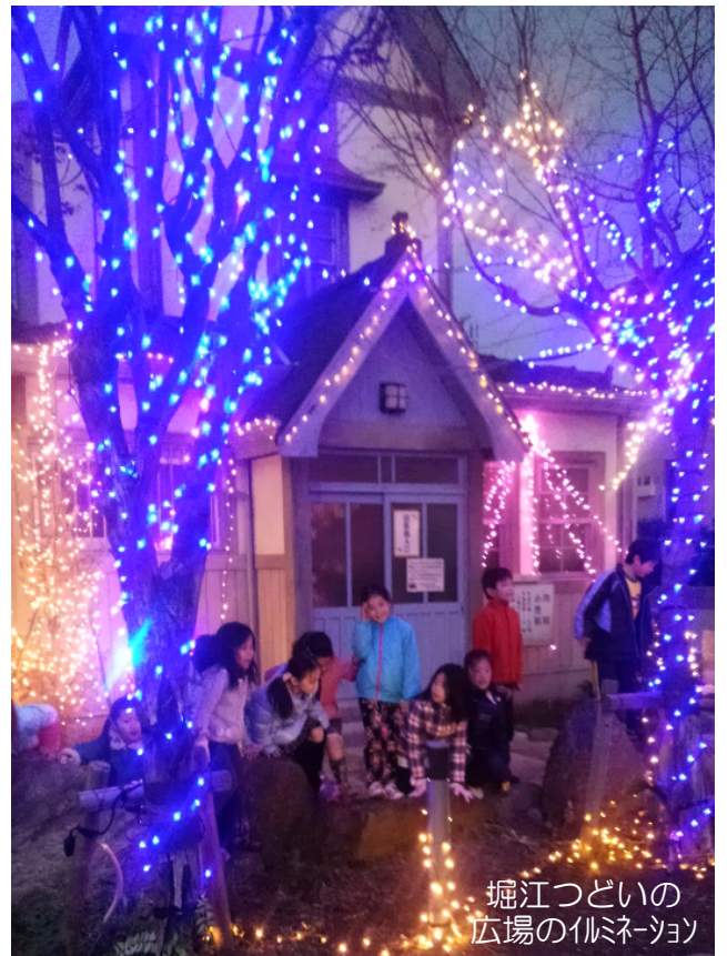
堀江つどいの広場のイルミネーション