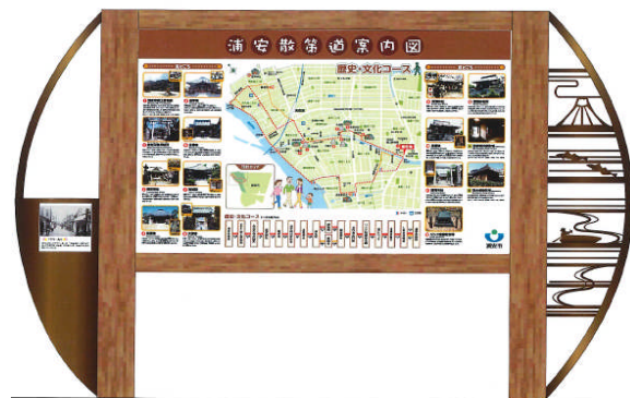
浦安散策道案内図（道路側）

道路側は、この地区に市内・市外から散策に訪れる方も増加していることから、散策道案内図として、元町散策路や訪れる神社仏閣、文化財を紹介しています。