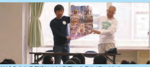
地域の方から祭りにかかる思いをうかがいました。