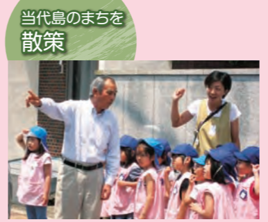
「ここは、神酒所って言うんだよ」地域の方が、本物のお神輿を見せてくださいました。