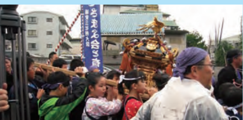
待ちに待った祭りの日。子どもたちも祭りを支える一人になりました。