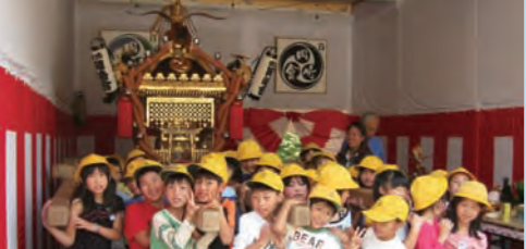
祭りの前に地域のおみこしを担がせていただきました。「面白い!」「かっこいい!」と歓声があがりました。