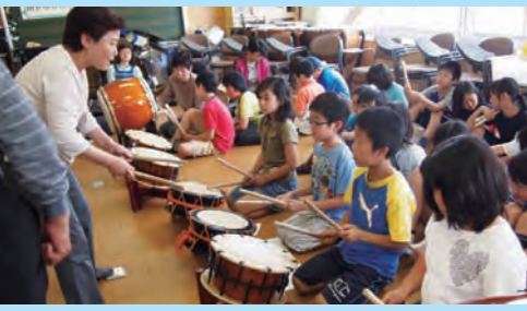
自分たちの力で祭りを成功させよう。練習中の子どもたちからはそんな思いが伝わってきました。