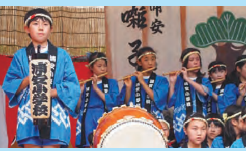
子どもたちによるお囃子の演奏でお祭りの雰囲気が一気に盛り上がりました。