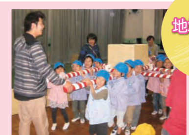
「マエダ!マエダ!」園児制作途中のおみこしを使って練習。「早く、お祭りしたいね」

まず「あおばようちえんのお祭りに来てください」「おみこしを見てみたいな」と三園の年長組がビデオレターでやり取りをするところから、交流が始まりました。その後、美浜北幼稚園と、日の出幼稚園がそれぞれ青葉幼稚園を訪れました。