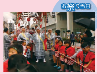
「わっしょい!わっしょい!」当代島の山車を、一緒に引かせてもらった園児たち。4年後は、小学生になって大きなおみこしを担ぐのかな...