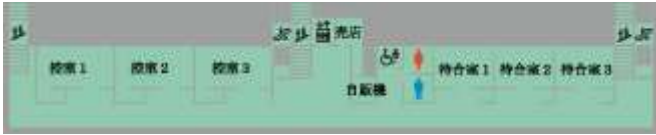
本館 2 F