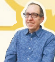
ブライアン・ローズ氏 (2001年オセロ世界王者)