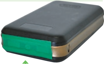
金属の端子部分を覆う