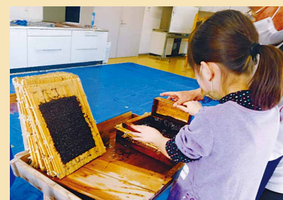
海苔すき体験の様子