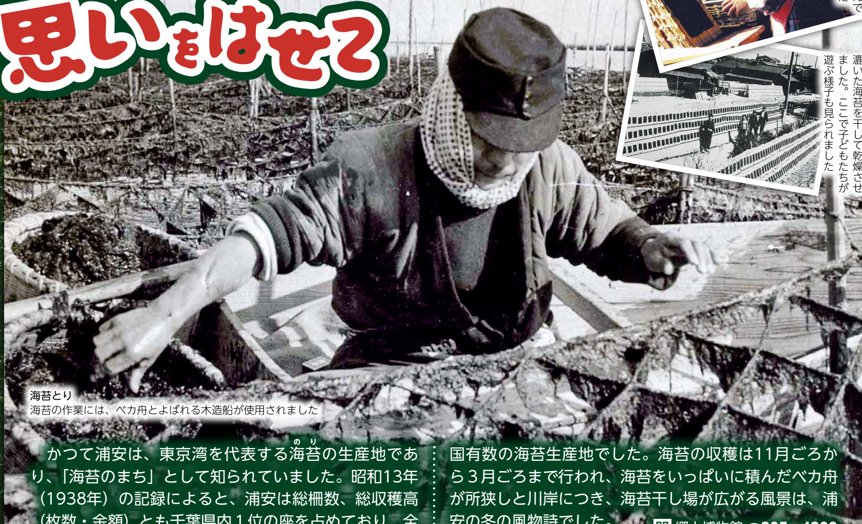
海苔とり 海苔の作業には、ベカ舟とよばれる木造船が使用されました

かつて浦安は、東京湾を代表する海苔の生産地であり、「海苔のまち」として知られていました。昭和13年（1938年）の記録によると、浦安は総柵数、総収穫高（枚数・金額）とも千葉県内1位の座を占めており、全