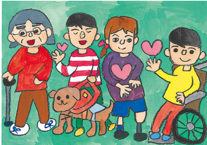
小学生（8歳） ※希望により匿名とします