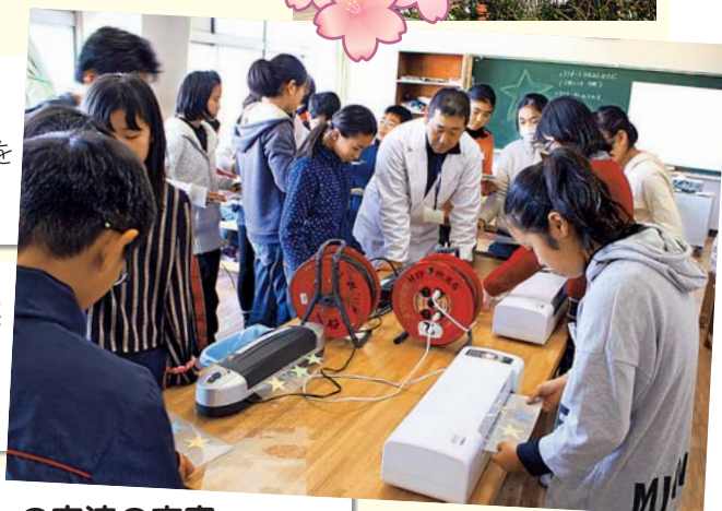
▲中学校の先生と連携した理科の授業の様子

「ホタルの里」や中学校の特別教室、植物工場、中学校図書などを活用し、豊かな学びを実現します。