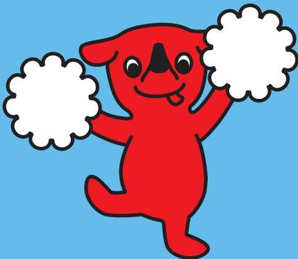
千葉県マスコットキャラクター 「チーバくん」