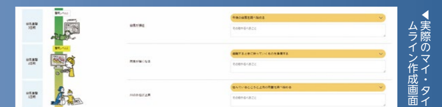
▲実際のマイ・タイムライン作成画面

▶ 国土交通省関東地方整備局ホームページ「マイ・タイムライン」 https://www.ktr.mlit.go.jp/river/bousai/index00000043.html