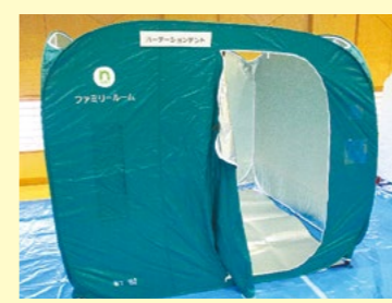
▲待避所に設置するパーティションテント

市では、避難者の健康状態の確認や、十分な換気の実施など、感染予防対策を行います。また、発熱、咳などの症状が出た方の専用スペースを確保します。