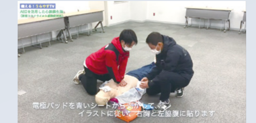
▲YouTube「浦安市【公式】チャンネル」より備える!うらやすTV

新型コロナウイルスの感染拡大防止のため、応急手当講習会は実施していません。再開が決まりしだい、市ホームページなどでお知らせします。また、心肺蘇生法についての動画をYouTubeで配信しています。「備える!うらやすTV」で検索し、ご覧ください。 https://www.youtube.com/watch?v=4XmBoiE8gg