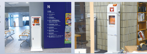
▲市役所1階エレベーター前 ▲中央図書館1階中央カウンター内

市内公共施設や自治会集会所、警察署や派出所、小学校や中学校などの教育機関、一部のコンビニエンスストアなどに設置しています。