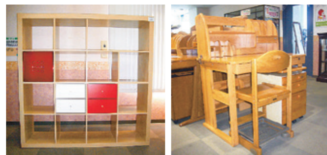
【飾り戸棚】4000円 高さ149.5cm、幅149cm 奥行39.2cm 【学習机】4000円 高さ117cm、幅102cm 奥行67cm

時 ビーナズプラザ開館日の午前9時～午後5時 所 ビーナズプラザ ●販売している再生家具の一例（2月22日現在） ※販売品は市ホームページでご覧になれます。すでに売却されている場合もありますので、詳しくは、お問い合わせください