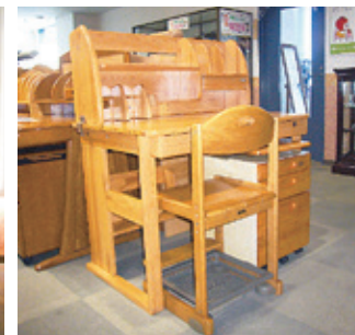
【学習机】4000円 高さ117cm、幅102cm 奥行67cm