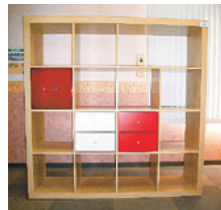
【飾り戸棚】4000円 高さ149.5cm、幅149cm 奥行39.2cm

時 ビーナズプラザ開館日の午前9時～午後5時 所 ビーナズプラザ ●販売している再生家具の一例（2月22日現在） ※販売品は市ホームページでご覧になれます。すでに売却されている場合もありますので、詳しくは、お問い合わせください