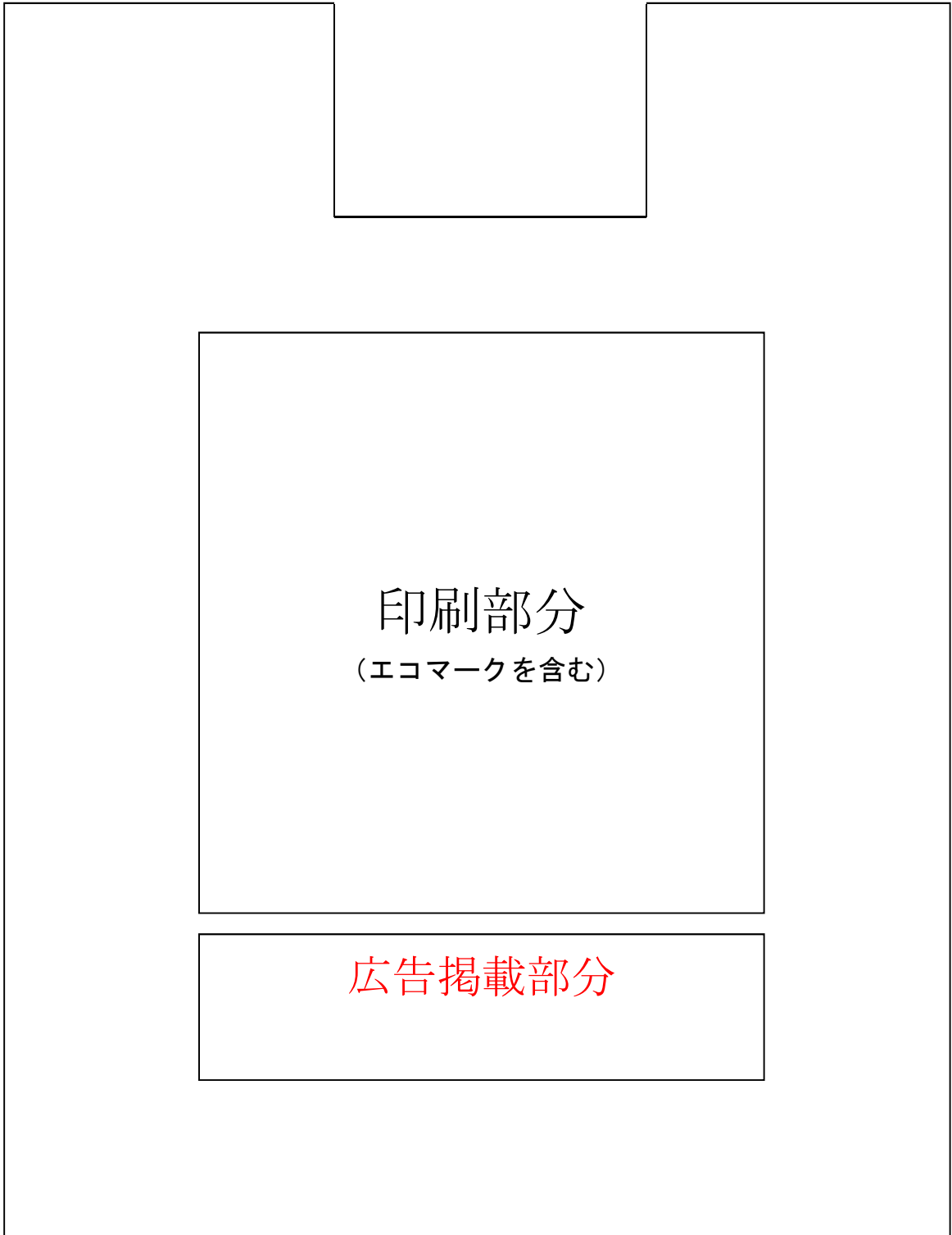
「U形袋」 (広告掲載バージョン)