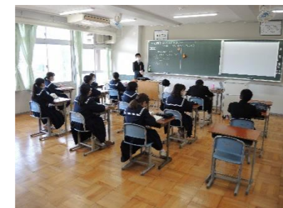
▲複数のクラスに分かれることにより、少人数による学習を行う。(浦安中)

学年・教科支援教員の配置により、状況に合った少人数指導を行っています。主に、算数や数学で実施することが多く、児童・生徒のニーズに応じた学習ができるよう心がけています。