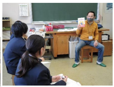
▲1年生対象のキャリア教育「働くクエスト」。児童書作家の方に話を聞く。(日の出中)

学ぶことと自己の将来とのつながりに見通しを持ち、社会的・職業的自立に向けて必要な能力を身に付けることができる取組を推進します。