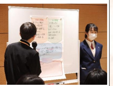
▲各中学校の代表生徒が集まって研修を行う。第2回研修は、市長の講話後、リーダーの姿について考えた。