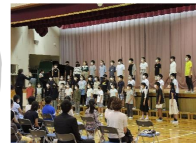
▲美浜中学校区音楽交流会 (美浜南小)

小・中学校音楽会や特別支援学級の児童生徒による「はっぴい発表会」、小・中学校音楽鑑賞教室等の充実を図り、文化・芸術活動体験を推進します。