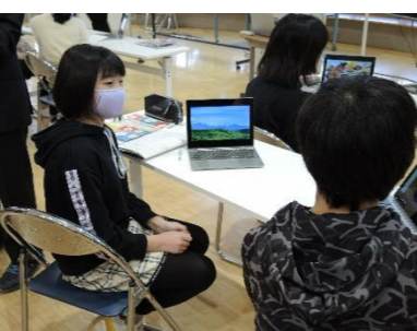
▲タブレットで資料を示しながら、自分のお気に入りの場所を英語で紹介する。(明海小)

児童・生徒に配付されたタブレットを利用した学習は、様々な広がりを見せています。教職員間で活用事例の共有を進め、よりよい活動につなげる取組を行っています。