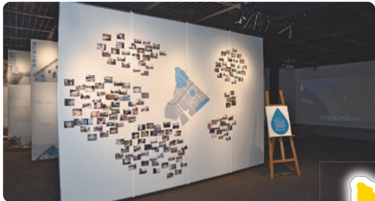
「フィールドワークの内容をまとめた浦安の地図」

今回は、東京藝術大学の学生と社会人の人材育成プログラムDOORの受講生が、浦安での暮らしと切り離せない「水」をテーマに、半年にわたり取材・撮影を行い、制作した映像「流れる、水の声ー浦安フィールドワークのビデオ/ボイス」の上映と写真などが公開されました。映像は、まちの風景や人の暮らしなどそれぞれの過ごし方や人生の積み重ねが映し出されました。