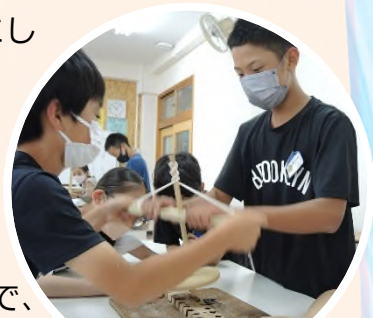
6年生「火起こし体験」みんなで力を合わせて火を起こします。(見明川小)

学芸員や職員の方々、地域のボランティアで、ある「もやいの会」の方々の協力を得ることで、子どもたちの学習が充実しています。