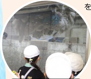
ごみピットの様子を見学する4年生。(東小)

を学び、市民の暮らしを支えてくれている人々がいることを感じるとともに、ごみの出し方について考えます。