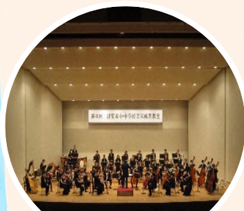
毎年、千葉交響楽団が出演

1000席以上の席数を誇る大ホールをはじめ、小ホールや会議室なども完備されています。毎年6月には、オーケストラの本格的な演奏を鑑賞する小中音楽鑑賞教室が開かれます。