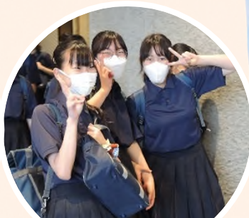
素晴らしい演奏にテンションも上がります。(富岡中)