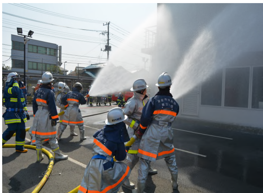
消防団・消防署合同訓練