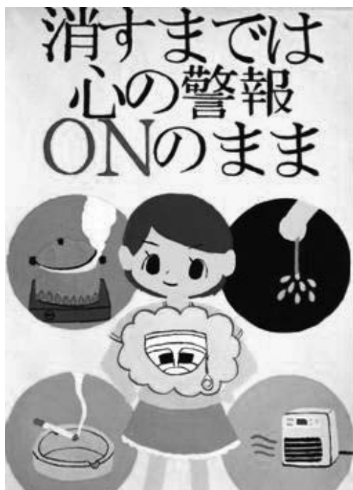
第 31 回浦安市防火ポスター展 中学生の部 市長賞作品