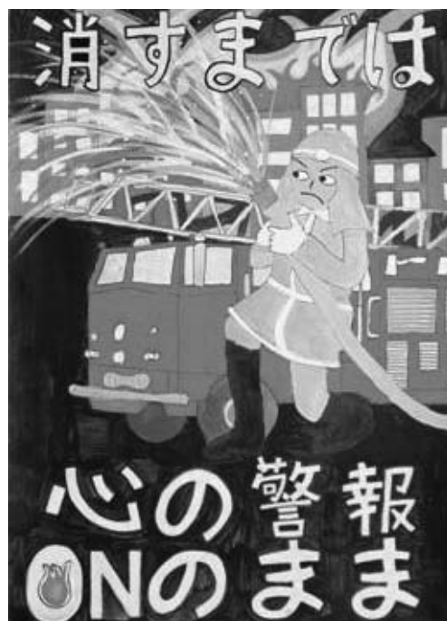
第 31 回浦安市防火ポスター展 小学生の部 市長賞作品