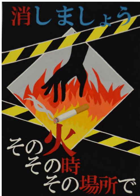
第34回浦安市防火ポスター展 中学生の部 市長賞作品