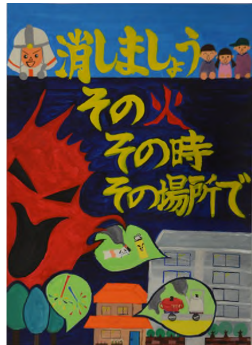
第34回浦安市防火ポスター展 小学生の部 市長賞作品