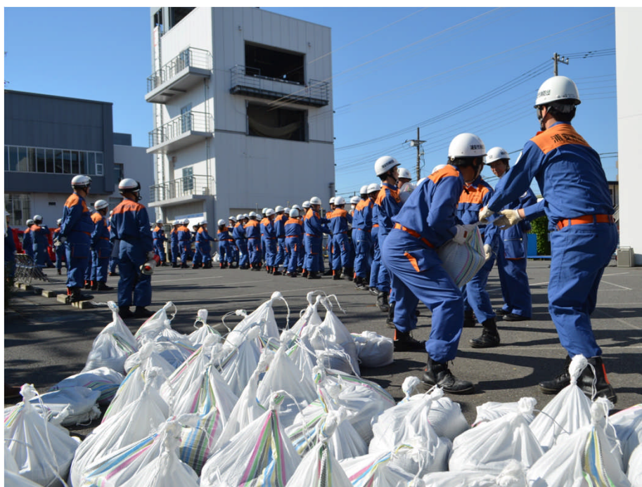
消防団・消防署合同訓練(水防訓練)