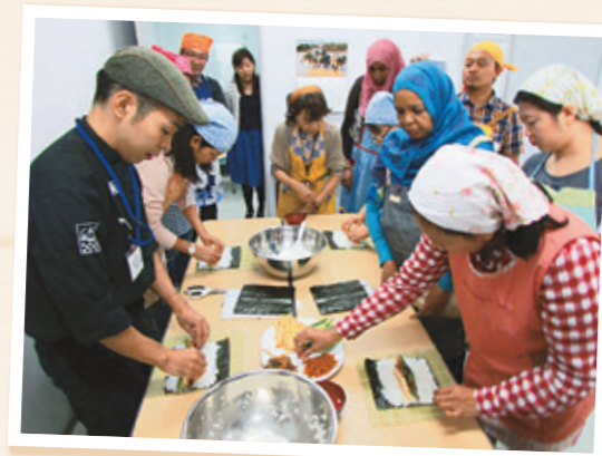
▲外国の方と和食作り

食にまつわる文化は、食材や調理法、食事のマナーなど、民族や国、風俗によって固有の特徴があります。食文化を通して、国や民族の文化を知る機会を作っています。