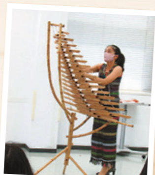
▲ベトナムの楽器、トルン