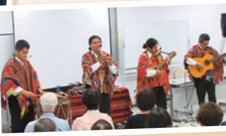
▲ペルーのアンデス音楽