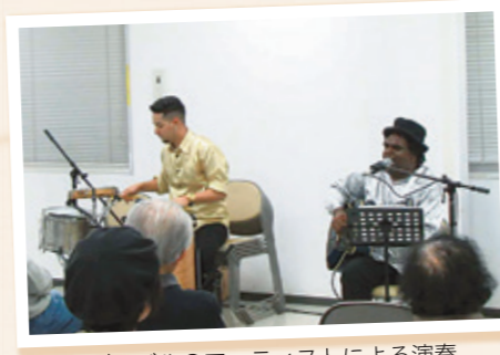
▲ブラジルのアーティストによる演奏

生活の中に古くから伝えられ、その地域や民族特有の性格をもった「民族音楽」。そんな音楽に触れる機会としてコンサートを開催しています。