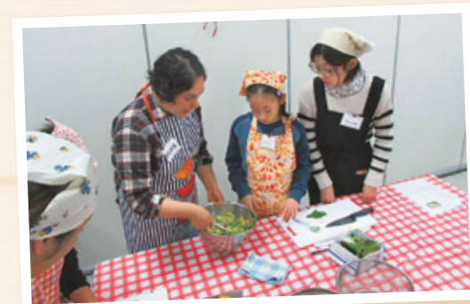
▲メキシコの料理、トルティーヤ作り