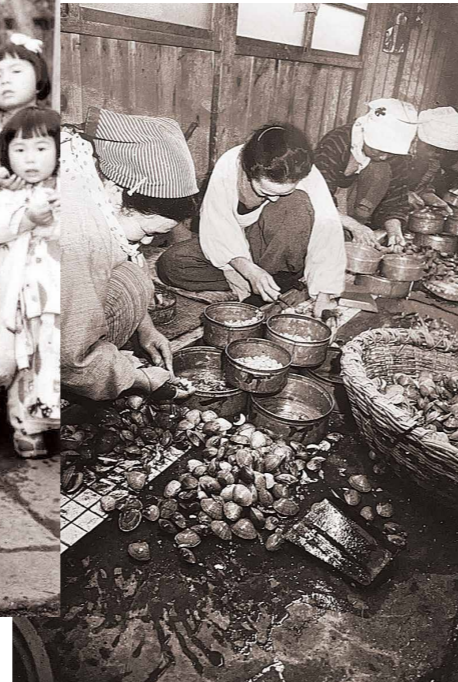
当時の貝ムキの様子

漁業が盛んだったころには、漁師は船に安全祈願のお供えをする「乗り初め」を行い、その年の縁起のよい方向に船を向け、1年の安全と豊漁を祈りました。 貝ムキをして市場に出すムキ屋などの商売をしている家でも、新年初めての出荷「初荷」を行い、得意先に年始のあいさつに回りました。