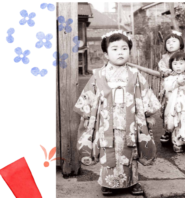
当時の正月の子どもたち

元日には、年男や子どもなどが朝早くに川へ行き、1年の邪気を除くといわれている「若水」をくみました。「初参り」に出かけたあとは、この若水を使って、お茶を沸かしたり、お雑煮を作ったりしました。現在は、川の水を飲料水として使わないため、元日に若水をくみに行く光景は見られなくなりました。