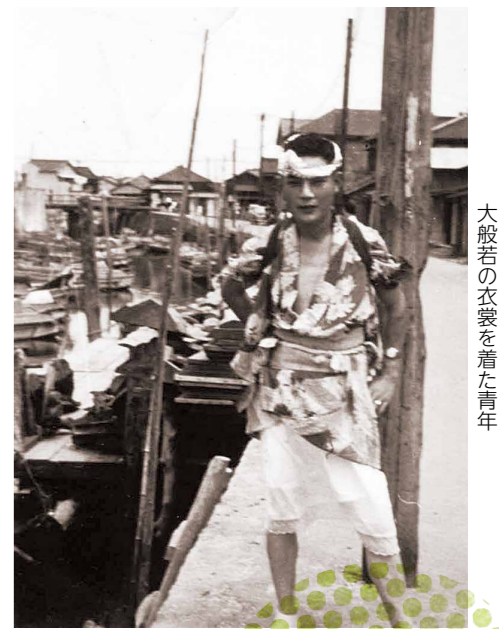
大般若の衣裳を着た青年

「大般若」は、堀江と猫実だけの行事で、10代の男が長襦袢を着て、鼻の頭に化粧をし、お経を取めた箱を担ぎながら、各家を回って、家内安全と悪い病気が流行しないことを願いました。