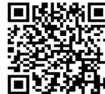
申込用二次元コード