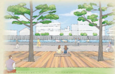
▲境川公園の整備イメージ