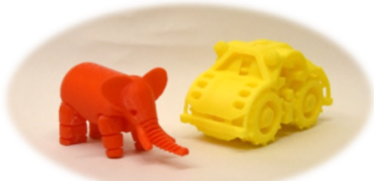
▲ 3Dプリンタによる 作品