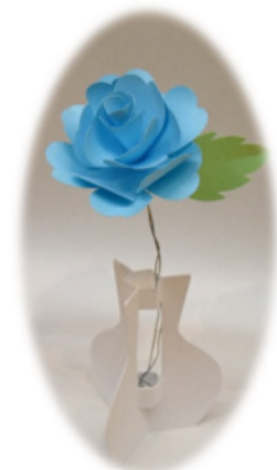
▲ カuttingマシン による作品