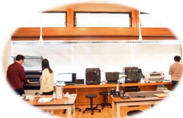
▲ たくさんの機器を使用 できます。