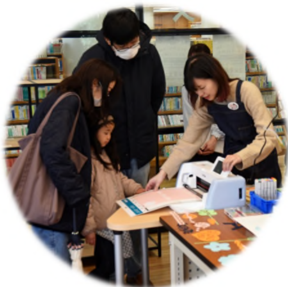
▲いろいろな機器を使っ てのイベントを企画して います。

3Dプリンタやレーザーカッターなど、デジタルファブリケーション機器を中心とした工房機能を備えた場所を整備し、市民の皆様になたなものづくり体験の場を提供する事業です。ものづくりを通じて、世代を超えた市民同士の交流を促進することを目指しています。