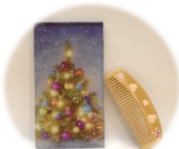
▲ UVプリンタによる 作品