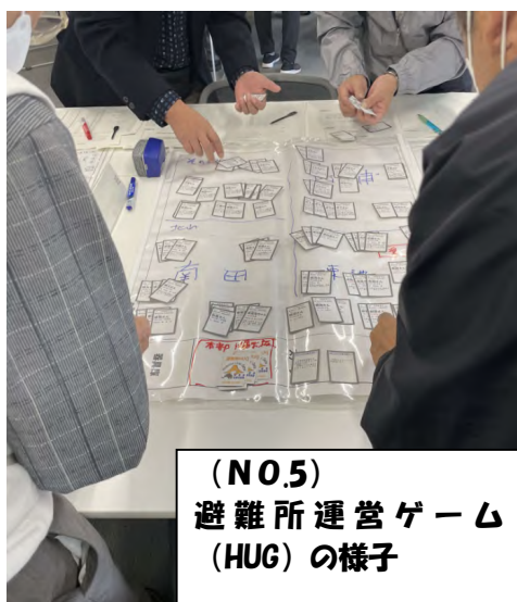
(N0.5) 避難所運営ゲーム (HUG)の様子

★ 11～16の体験等についての申し込みは 浦安市消防本部総務課 TEL 047-304-0142