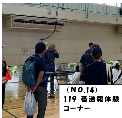
(N0.14) 119番通報体験 コーナー