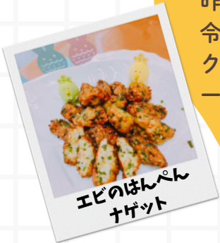
エビのはんぺん ナゲット

昨年度4クラブでスタートした「URAYASU文化クラブ活動」令和8年度は学校部活動にはない活動を8クラブに拡充し実施予定。クッキングクラブでは「楽しく、大人顔負けの料理を作る」がモットーです！