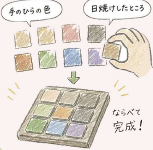
完成作品(イメージ)

多様なタイルの中から自分の体の色を選ぶ。アーティストの問いかけを通して、どの部位の色かどのように見つけたかを対話しながら制作する。